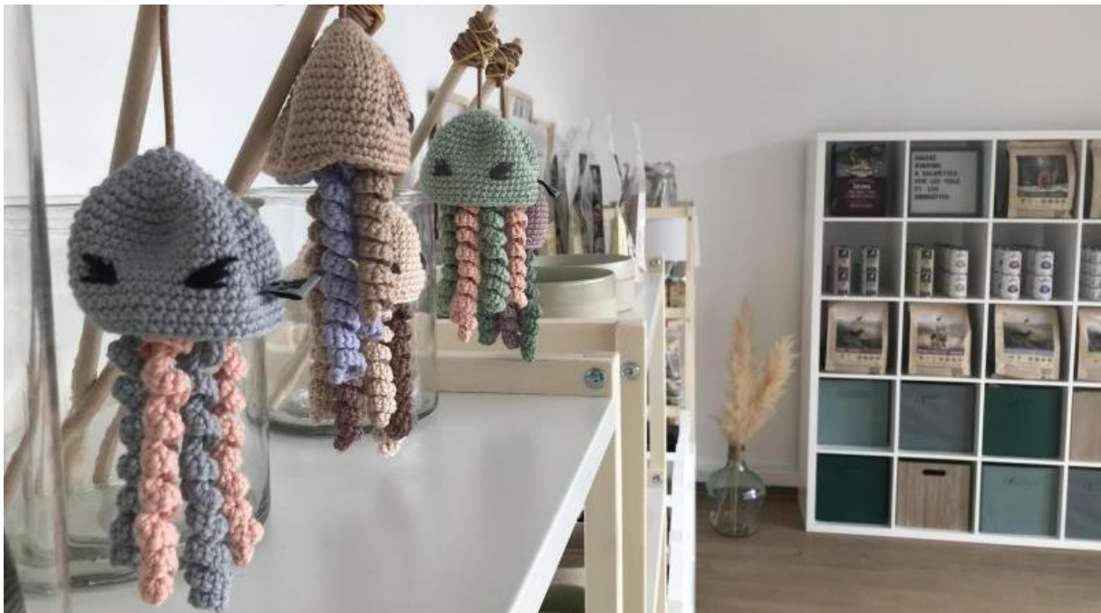
Les jouets pour chats sont fabriqués à la main.