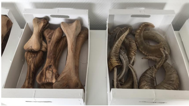
Les «objets de mastication» sont fabriqués en produit naturel (bois d'olivier ou corne de buffle).