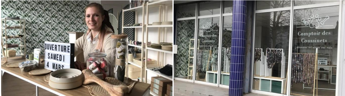
Comptoir des coussinets est sur le Grand boulevard marquois.